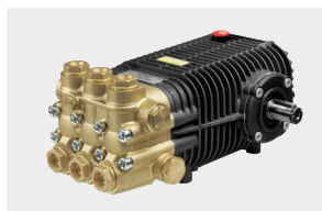
SW / TW Premium