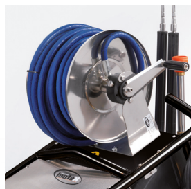
The S.S. hose reel can be mounted on request, with 20, 40, 60 m hose